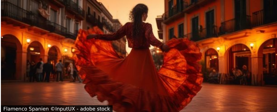
Flamenco Spanien

Hoffentlich nehmen wir den Mund nicht zu voll, doch wir sind sicher, dass Sie diesen Jahreswechsel in Barcelona nie vergessen werden. Oder haben Sie schon einmal versucht, zwölf Uhr nachts zwölf Weintrauben zu verspeisen während die Glocken zwölf mal schlagen und das neue Jahr einläuten? Zu einem unvergesslichen Erlebnis trägt auch die unglaubliche Schönheit dieser pulsierenden Mittelmeermetropole bei – geprägt nicht nur von den Werken Gaudís, dem größten Sohn der Stadt, dessen Spuren wir auf einer Stadtrundfahrt folgen werden. Die beeindruckende Kathedrale Sagrada Familia und der Park Güell sind nur zwei der vielen Beispiele seines Schaffens.