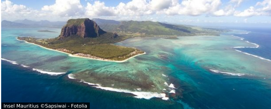
Insel Mauritius