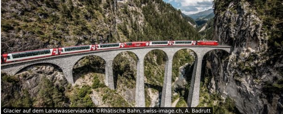
Glacier auf dem Landwasserviadukt