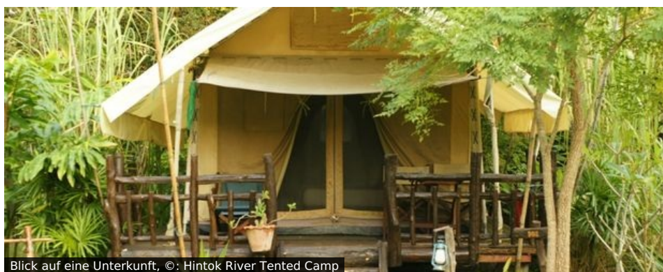
Blick auf eine Unterkunft

Lage Das Zeltcamp liegt idyllisch direkt am River Kwai inmitten der unberührten Natur des Erawan Nationalpark. Zelte Die klimatisierten Zelte sind mit komfortablen Betten, privater Dusche/WC, Külschrank und privater Veranda ausgestattet. Hotelausrichtungen Den Gästen steht im Clubhaus WIFI zur Verfügung. Es gibt ein Restaurant, von dessen Terrasse man auf den River Kwai schauen kann. Regelmäßige Lagerfeuer werden angeboten. Genießen Sie youtu.be/nnET1xGKtz0 _blank external-link-new-window "© Hintok Tented River Camp">hier</link> einen ersten Einblick. Weitere Informationen finden Sie unter: www.hintokriverscamp.com _top external-link-new-window "Opens external link in new window">www.hintokriverscamp.com</link>