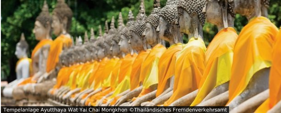
Tempelanlage Ayutthaya Wat Yai Chai Mongkhon