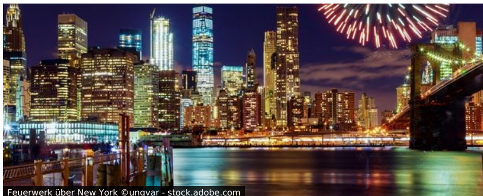
Feuerwerk über New York

„Die Stadt, die niemals schläft!“ Auch in der Nacht vom 31.12. auf den 1.1. macht New York seinem Namen alle Ehre, denn wohl nirgends wird das neue Jahr mit ähnlich spektakulärer Inszenierung begrüßt.