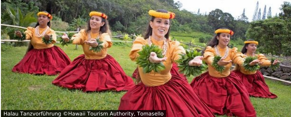
Halau Tanzvorführung