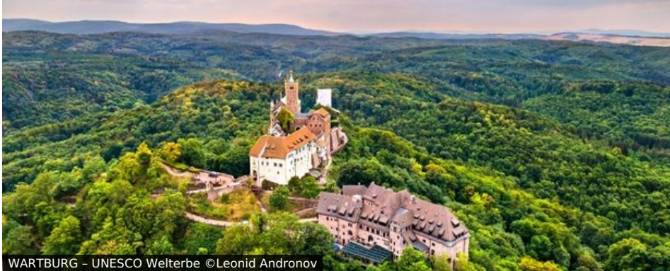
WARTBURG - UNESCO Welterbe