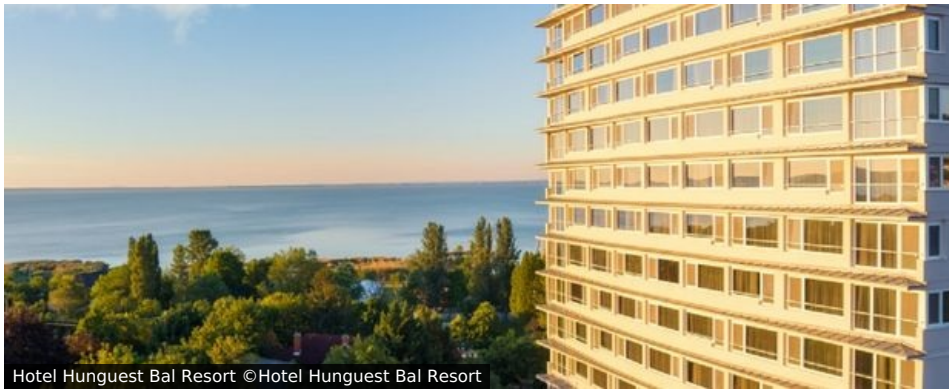
Hotel Hunguest Bal Resort