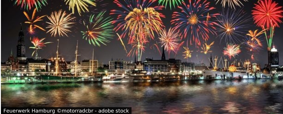
Feuerwerk Hamburg