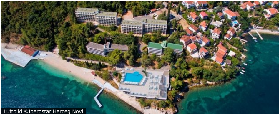
Luftbild ©Iberostar Herceg Novi