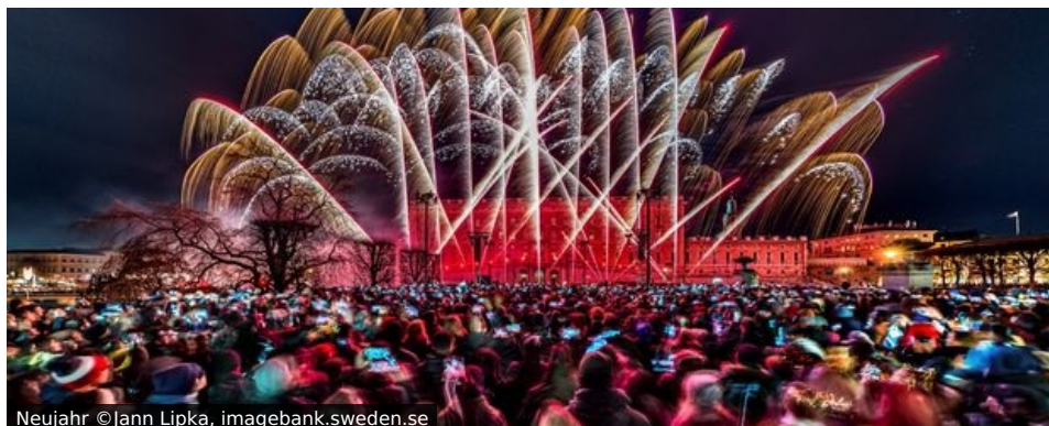
Neujahr

Vermutlich haben Sie sich noch nie gefragt, wie es wäre, bei Pippi Langstrumpf oder Michel aus Lönneberga Silvester zu feiern. Nach dieser Reise kennen Sie trotzdem die Antwort - wenn Sie möchten aus eigener Anschauung. Denn eine typisch schwedische Silvestersause findet ganz stilecht im historischen Gebäudeensemble des Freilichtmuseums Skansen in Stockholm statt, wo über 150 Gebäude aus fünf Jahrhunderten und u.a. in die Welt der Astrid Lindgrén Abenteuer entführen.