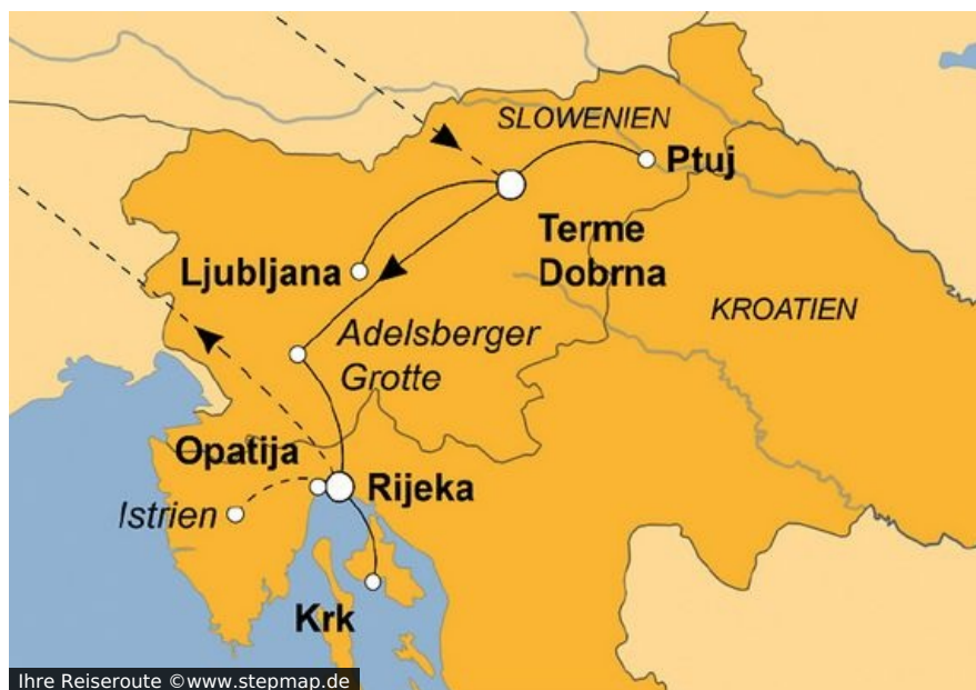
Ihre Reiseroute ©www.stepmap.de

Fangfrischer Fisch oder rassiger Wein? Heilende Thermalquellen oder azurblaue Adria? Gigantische Tropfsteinhöhlen oder sonnendurchflutete Inselwelten?