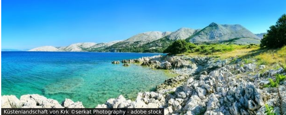
Küstenlandschaft von Krk