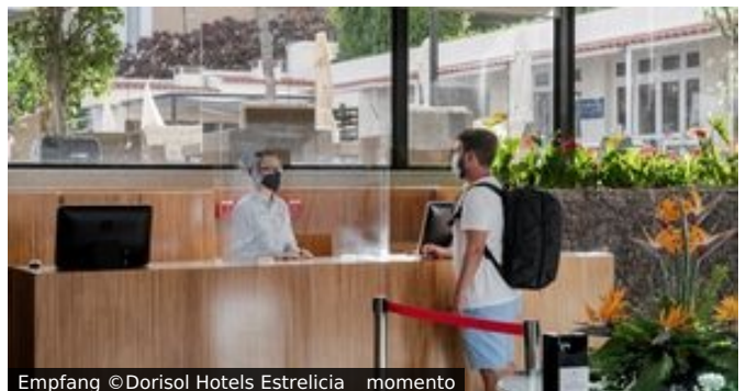
Empfang ©Dorisol Hotels Estrelícia _ momento

Lage und Ausstattung: Das Hotel Estrelícia liegt zusammen mit den beiden Dorisol Schwesterhotels inmitten Madeiras schönem und beliebten Hauptort Funchal, umgeben von zahlreichen Restaurants, Bars und Geschäften. Bis zu den bekannten Lido Meeresschwimmbädern und zum Meer mit Promenade sind es ca. 10 Gehminuten. Die sehenswerte Innenstadt ist ca. 2 km entfernt. Diese einladende Unterkunft verfügt über einen schönen Swimmingpool (Liegen und Sonnenschutz inklusive), an den direkt das gepflegte und beliebte Snackrestaurant mit Bar angrenzt. Zudem verfügt das Hotel auch über ein Hallenbad mit Sauna und Whirlpool. In der Bar im Innenbereich gibt es mehrmals pro Woche Abendunterhaltung. Im Restaurant mit Außenbereich wird Frühstück und Abendessen serviert.