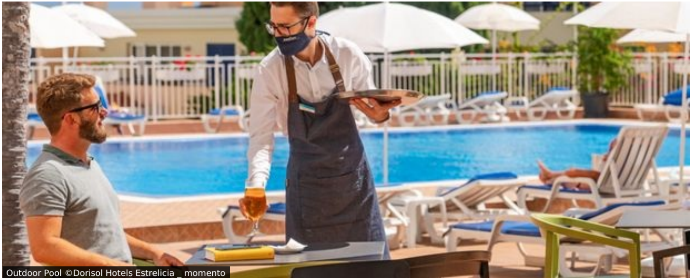
Outdoor Pool ©Dorisol Hotels Estrelícia _ momento