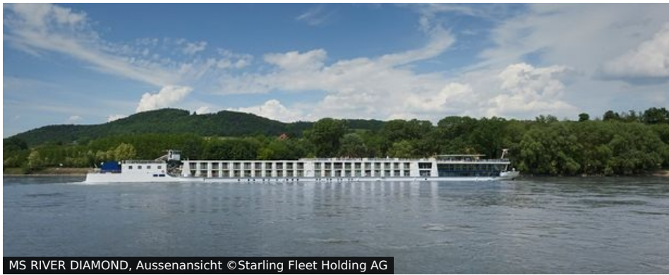
MS RIVER DIAMOND, Aussenansicht

Willkommen auf der eleganten und modernen MS RIVER DIAMOND! Das Schiff wurde 2007 gebaut und komplett renoviert. Auf einer Länge von 135 Metern bietet das Schiff bis zu 170 Passagieren Platz. Die Bauweise als "Twin Cruiser", d.h. mit getrennter Passagier- und Antriebseinheit, sichert den Fahrgästen eine nahezu geräusch- und vibrationsarme Fahrweise zu. Die offene Treppe zwischen Ober- und Mitteldeck wird durch viel Tageslicht über eine Glaskuppel beleuchtet und trägt neben der Einrichtung zum hellen und freundlichen Ambiente des Schiffes bei. Das Sonnendeck mit vielen Liegestühlen sowie eine Markise laden zum Entspannen an Bord ein. Ein Internetcafé, eine Bibliothek, ein kleines Fitnessstudio und eine Bar runden das Angebot an Bord ab. Die Atmosphäre an Bord ist gemütlich und ungezwungen, aber beim Galadinner darf es auch etwas festlicher sein.